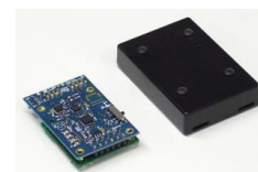
9 軸モーションセンサ