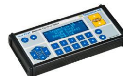
トリガー／マイク入力機能 付きリモコン