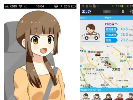
アプリ例 左:助手席カノジョ(株)ネクスティス

スマホアプリ部門、Web アプリ部門のカテゴリで幅広いアプリ開発者の参加を可能とします。