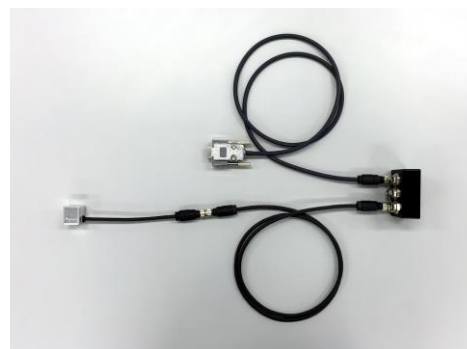
ハブ経由での接続例