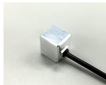
ZMP® IMU-Z Cube