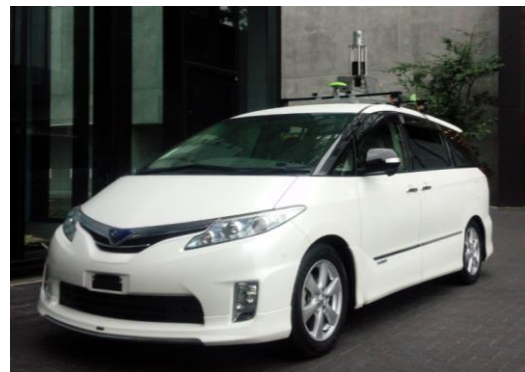
<Autoware 搭載 RoboCar MiniVan>

市販ハイブリッド車ベース自動運転技術開発プラットフォーム RoboCar に、レーザレーダ、カメラなどの環境センサを搭載、自動運転ソフトウェアとして Autoware を実装することで、自車位置や周囲物体を認識しながら、カーナビから与えられたルート上を自律走行することが可能となります。ZMP は、センサの選定および車両への搭載、Autoware のインストールと車両をスムーズに制御するための RoboCar MiniVan のチューニングを行い、テストコースでの走行テストを行った上で自動運転システム実験車両として納品をします。併せてご要望にあわせて技術サポートサービスを提供、お客様のスムーズな自動運転技術の研究開発を支援します。