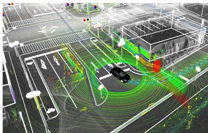
<自動運転ソフトウェア Autoware の画面イメージ>